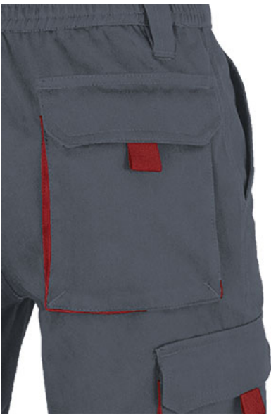
Detalhe bolso lateral